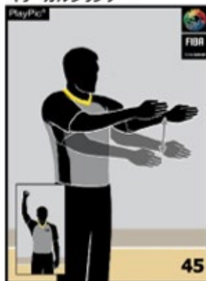
イリーガルシリンダー