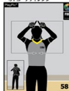
ヘッドコーチチャレンジ