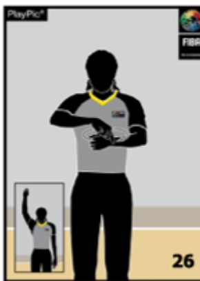
ゴールテンディング/インタフェアレンス