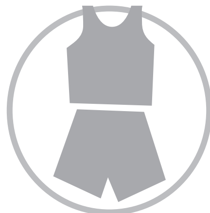
事前の更衣にご協力