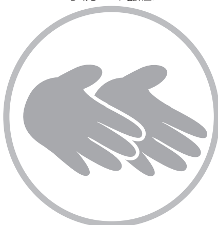
アルコール消毒の徹底 手洗いの徹底