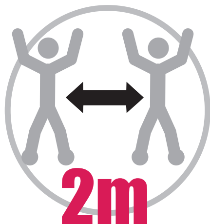
ソーシャルディスタンス確保